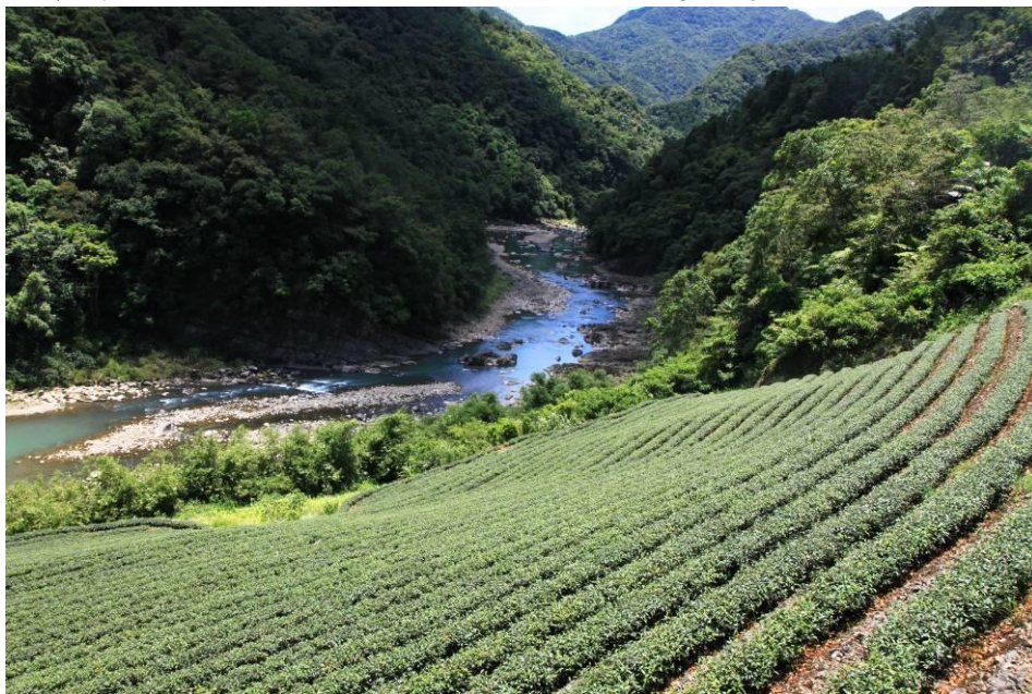
圖 1-1 坪林區茶園風貌

坪林境內多山，林木蓊鬱，北勢溪貫穿區內，支流眾多，有著農林漁相兼的產業型態，是一處典型的山城聚落。坪林區的地勢是屬於丘陵及中級山岳地區，境內山巒峻嶺環繞，北面為伏獅山系，南面為阿玉山系，平地少而多陡坡，全區位置高度約在海拔 150 公尺至 1200 公尺之間，地形起伏變化甚大。