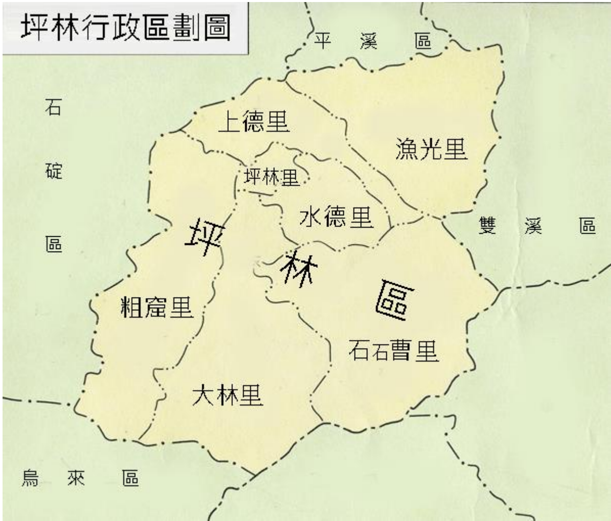
圖 1-2 新北市坪林區行政區域圖