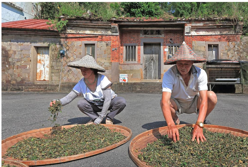
圖 1-4 本區獨特之茶葉特色

餘工商活動的開發均受到限制，整體產業因土地利用條件之種種限制因素，發展呈現瓶頸，就業人口亦無法提升。居民就業困難，多數之青壯人口均向外發展居多，導致人口外移。此外，全區房舍新建或改建亦受到層層限制，老舊房舍更新成本高，只能任其荒廢，亦降低了居民的生活與住宅品質。