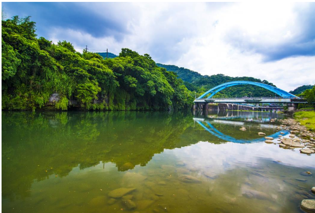
圖 1-5 本區藍色拱橋

坪林區擁有豐富之自然景觀與獨特之歷史背景，為強化坪林位於水源保護區且「一家工廠都沒有」之優質特色，市府於 2008 年創全國之先開辦「坪林低碳旅遊」，並成立全國第一個低碳旅遊服務中心；結合當地歷史人文特色與自行車道週邊的自然景觀，搭配當地民眾投入擔任導覽解說，深度感受坪林獨有的人文特色與生態景觀，以新興低碳產業的模式，成功地吸引因北宜高速公路通車而流失的觀光旅遊人潮，活絡坪林當地的經濟發展。