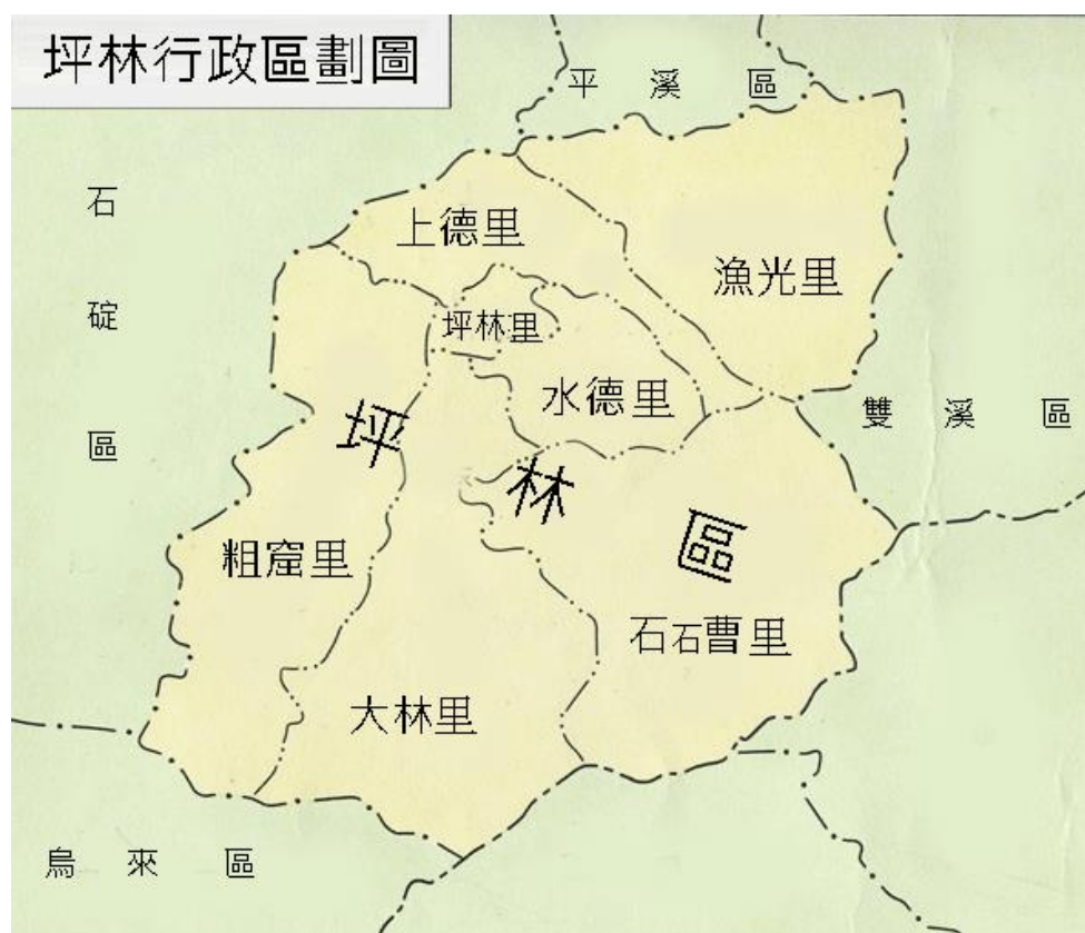
圖 1-7 本區行政區域圖

去六死，三留一回頭」，因此在臺初期，有很多人需要海神的保佑。保坪宮主祀「北極玄天上帝」，鄉民大多稱為「上帝公」，玄天上帝是鎮守北天之神，就像燈塔與北極星一般，能指引海上船隻航行方向，信徒深信上帝公除了是很值得信賴的海神之外，還有治病的神力，並且能永遠保佑坪林這塊地方。保坪宮早期建築非常克難，只有茅草屋頂，後來得鄉民捐錢加蓋及改裝，現在是兩層樓形式，還有遮陽遮雨的天棚。農曆 3 月 3 日玄天上帝的生日，是坪林區最為重要的慶典日之一，農曆 1 月 15 日元宵節，此處也有迎燈遊行，農曆 10 月 27 日則是年尾的演戲拜拜。