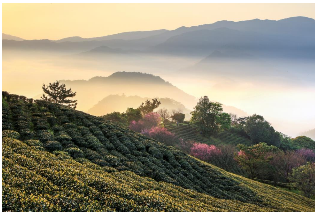
圖 1-3 本區茶園雲海

森林景觀，低於海拔 300 公尺者占全面積的 20%，低於海拔 500 公尺者占 60%。此範圍內之氣候溫暖潮濕雲霧瀰漫，而且丘陵地形利於排水，透水性佳且土壤偏酸性，四季有雨，適合種植茶葉，因此坪林區茶園綿延起伏，是北台灣高品質茶葉的產區，享譽全台的文山包種，全區皆有種植，種植面積以坪林里、大林里、粗窟里較為密集，約植於 400~700 公尺的坡地，植被良好，景色秀麗，亦是本地獨特的景觀之一。