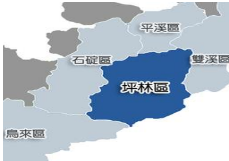
圖 1-1 本區地理位置圖

坪林區位於台北盆地的東南方，地處新北市與宜蘭縣的交接處。本區的東南方與宜蘭縣的頭城和礁溪相連接，東北方則和雙溪區為鄰，北方和平溪區為界，西北邊和西邊則毗鄰石碇區及烏來區。本區位於北宜公路的中途站，向東南可通往宜蘭縣頭城鎮，向西北則通往新北市新店區，以坪林為中心二十公里範圍內有台北、新店、烏來、汐止、頭城、礁溪以及宜蘭等重要城區。全區面積 170.84 平方公里，為新北市之第三大區。