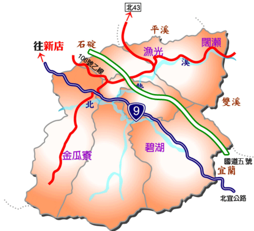
圖 1-2 本區交通聯絡道

坪林的交通在原有的台 9 線(北宜公路)、106 乙、北 42 線(坪林產業道路，編制僅到闊瀨)，因國道五號(雪隧)開通而大大增進南來北往的便利性；公共運輸部份目前有綠 12 路：坪林 - 捷運新店站：行經北宜公路、923 路：坪林 - 捷運新店站：行經北宜高速公路、9028:蘇澳-捷運大坪林站:行經北宜高速公路，每整點停靠坪林。